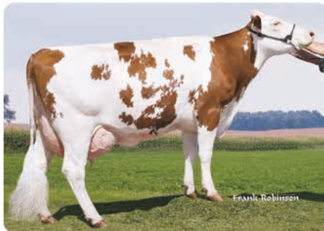
Krowa krzyżówkowa, USA (MB x SRB x HF), laktacja 305 dni - 13.059 kg

Kluczem do uzyskania maksymalnego efektu heterozji jest kojarzenie zwierząt o możliwie jak najmniejszym stopniu spokrewnienia. Dlatego zaleca się krzyżowanie rotacyjne trójrasowe, gdyż przy użyciu 2 ras efekt heterozji może być dużo niższy. Idealne byłoby użycie do krzyżowania 4 ras, ale nie jest to możliwe - nie ma na świecie czwartej rasy, która posiadałaby tak doskonałe cechy jak rasy HF, SRB i Montbeliarde i nie byłaby jednocześnie spokrewniona z którąś z tych ras. A spokrewnienie obniża efekt heterozji i pogarsza wartość potomstwa uzyskanego z krzyżowania.