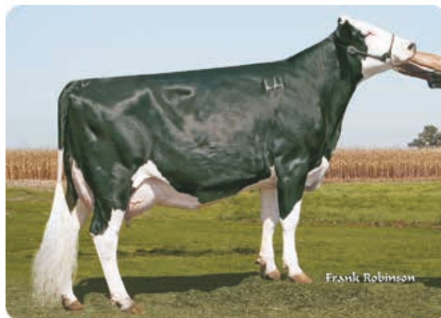
Krowa krzyżówkowa, USA (SRB x MB x HF), laktacja 305 dni - 11.499 kg